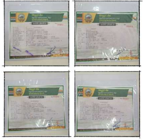
छायाचित्र: नवजात मुलींची ठेव योजना