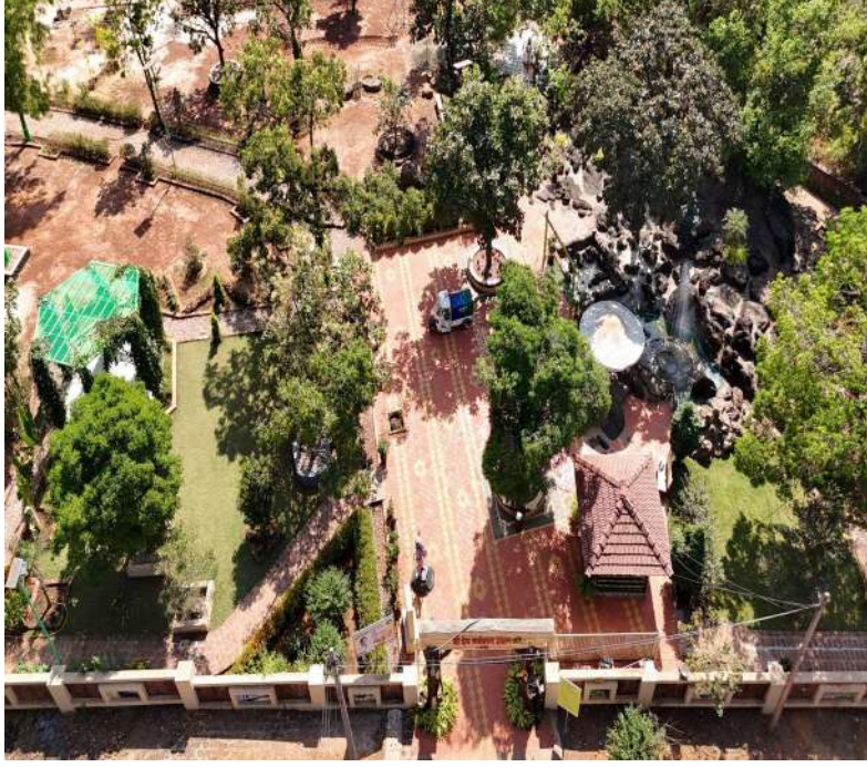
छायाचित्र: धार्मिक स्थळांचे सुशोभीकरण

धार्मिक स्थळांचे सुशोभीकरण केल्याने परिसर आकर्षक होतो, स्थानिक ओळख मजबूत होते आणि भाविकांसाठी सोयी वाढतात.