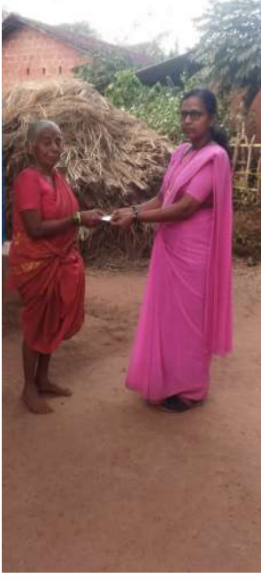
छायाचित्र: आयुष्यमान कार्ड

१.११ ग्रामपंचायत बजेट नुसार ग्रामपंचायतकडील दिव्यांग कल्याण, महिला व बालकल्याण तसेच मागासवर्गीय कल्याणावर अनुक्रमे ५%, १०% व १५% तरतूद करणे व १००% खर्च करणे