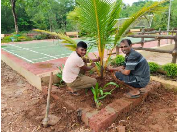
छायाचित्र: वृक्ष लागवड