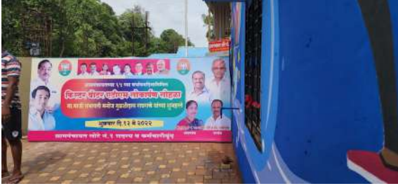
छायाचित्र: शुद्ध पाणीपुरवठा