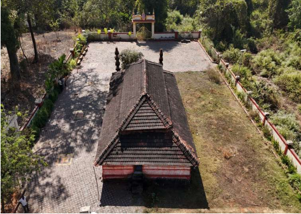
छायाचित्र:धार्मिक स्थळांचे सुशोभीकरण

धार्मिक स्थळांचे सुशोभीकरण केल्याने परिसर आकर्षक होतो, स्थानिक ओळख मजबूत होते आणि भाविकांसाठी सोयी वाढतात.