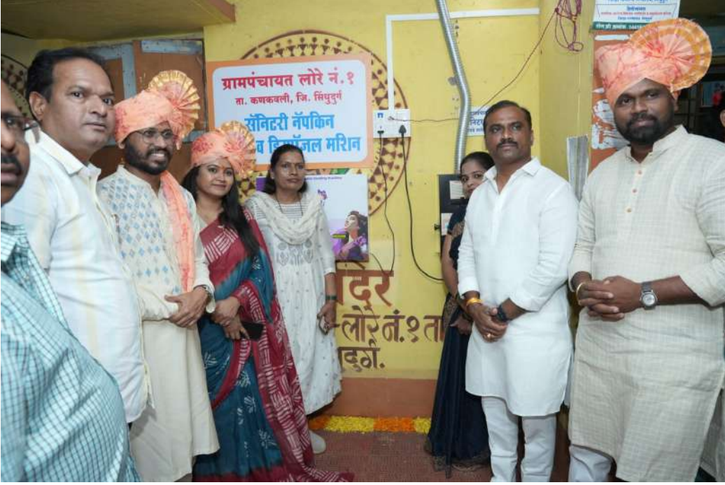
छायाचित्र:सॅनिटरी नॅपकिन सुविधा

सॅनिटरी नॅपकिन सुविधा महिलांच्या आरोग्य, स्वच्छता आणि सुलभ उपलब्धतेसाठी उपयुक्त ठरते.