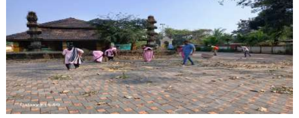
छायाचित्र: स्वच्छता अभियान

७.१ रस्त्याची कामे व रस्ते दुरुस्ती करणे तसेच पानंद रस्ते प्राधान्याने कामे करणे व दुरुस्त करणे रस्ते व पानंद दुरुस्तीमुळे वाहतूक, शेतीसाठी प्रवेश आणि दैनंदिन संपर्क अधिक सुलभ होतो.