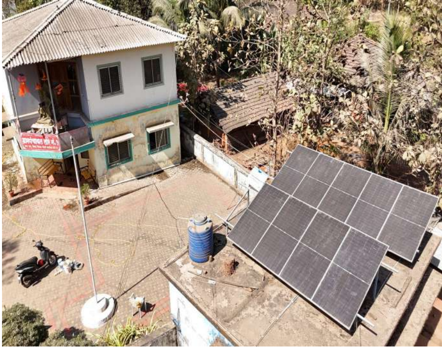
छायाचित्र:-ग्रामपंचायत इमारतीमध्ये सोलर

या उपक्रमामुळे ग्रामपंचायतीच्या कामकाजात सुधारणा, सुलभता आणि लोकाभिमुखता वाढते.