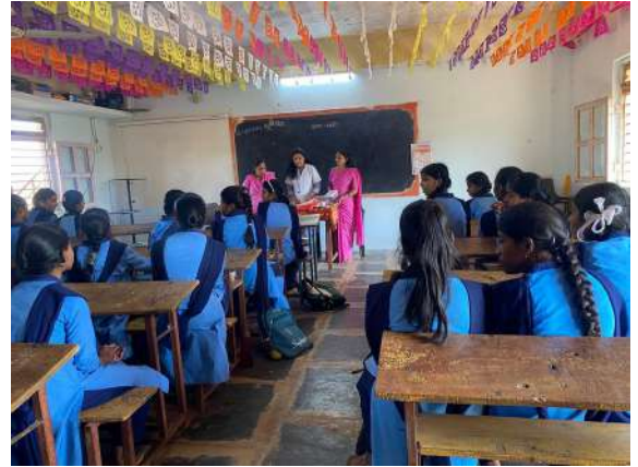
छायाचित्र: अॅनिमिया मुक्त गाव