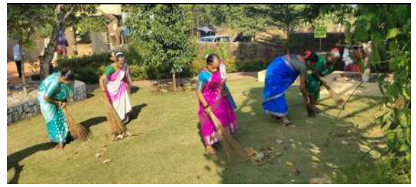
छायाचित्र: स्वच्छता अभियान