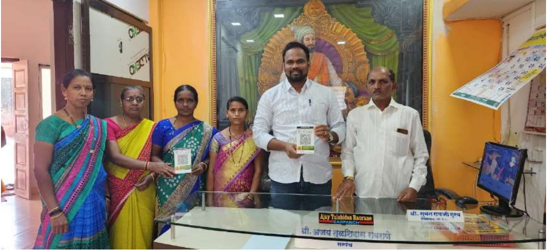
छायाचित्र: ऑनलाईन सेवा

ग्रामपंचायतीच्या सेवा डिजिटल माध्यमातून उपलब्ध केल्यामुळे अर्ज प्रक्रिया, माहिती मिळवणे आणि सेवा घेणे अधिक जलद व पारदर्शक होते.