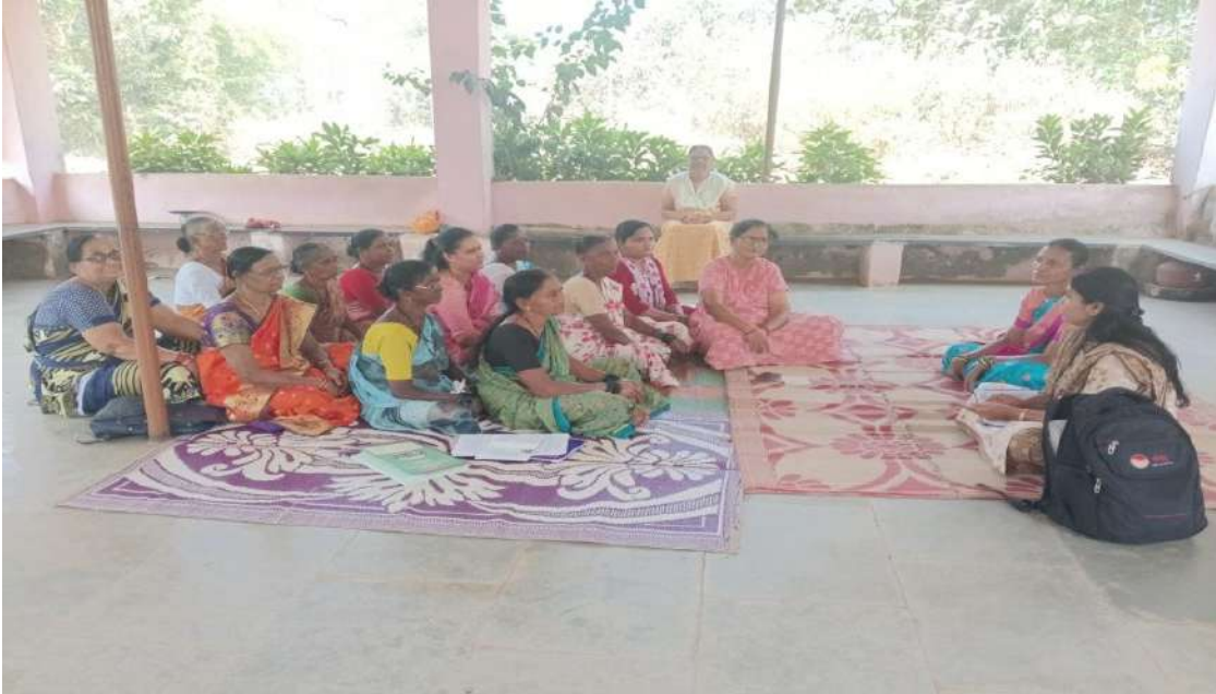
छायाचित्र:ग्रामपंचायत क्षेत्रातील स्वयंस