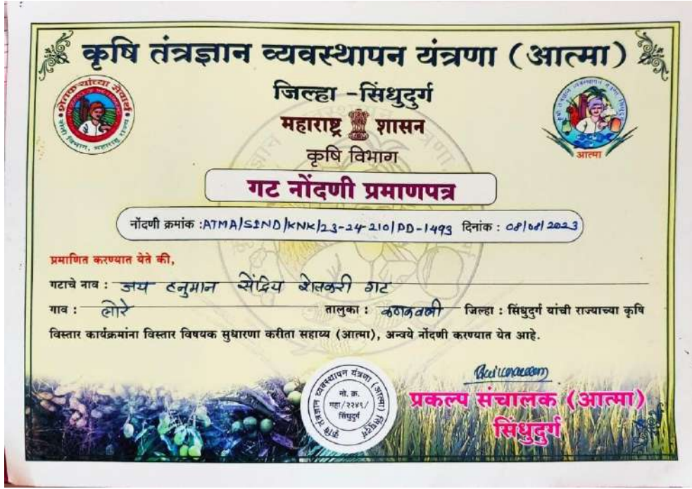
छायाचित्र: गट शेती सहभाग

गट शेतीमुळे सामूहिक नियोजन, खर्चात बचत आणि शेती उत्पादनाची क्षमता वाढते.