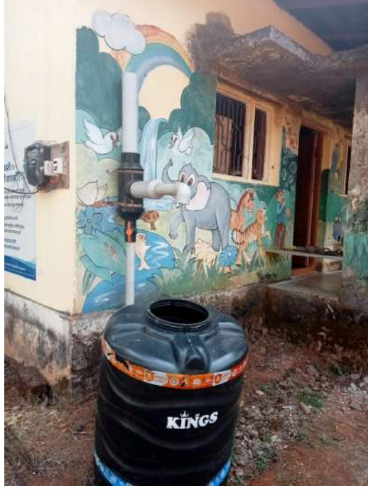
छायाचित्र:रेन वॉटर हार्वेस्टिंग

पावसाचे पाणी साठवून पुनर्वापर केल्यास भूजल पातळी सुधारण्यास मदत होते आणि पाणीटंचाई कमी करता येते.