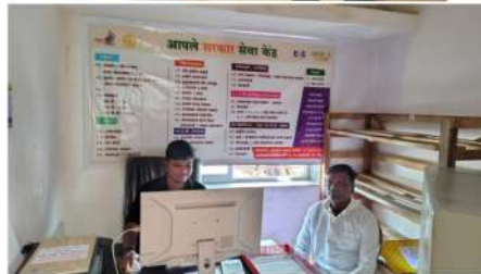
छायाचित्र: नागरी सेवा सुविधा केंद्र दर्जा